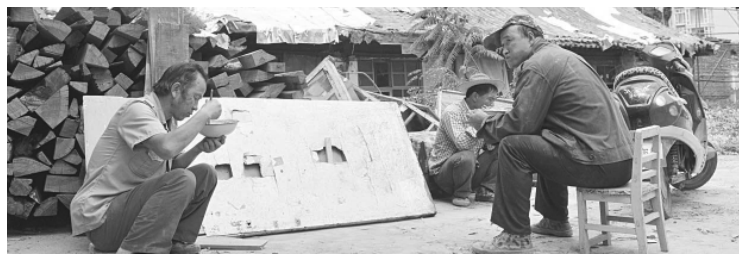
户籍改革主要任务是解决已转移到城镇就业的农业转移人口落户问题。图为8月30日，山西太原一处建设工地内吃午饭的农民工。中新社

三要有序推进。要优先解决存量，有序引导增量。既要积极、又要稳妥、更要扎实，不刮风、不冒进、不搞运动。