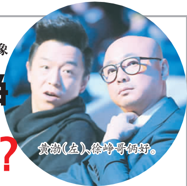
黄渤(左)、徐峥哥俩好。