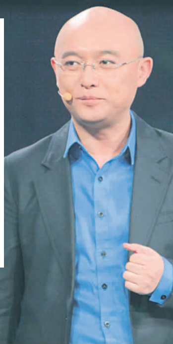
江苏卫视《非诚勿扰》的主持人孟非。

江苏卫视工作人员表示，冯小刚一行在江苏卫视待了半天时间。“主要还是为了春晚而来，如果央视需要我们配合，我们肯定也是尽量配合。”但是对于座谈的具体内容，双方都极力回避，只是表示还在意向阶段。