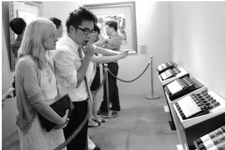
8月18日,为迎接中法建交50周年,中国文化部中外文化交流中心、文化部恭王府管理中心、对外友协中外友好国际交流中心、外文局外文出版社将联合举办了一场特殊的画展——2013首届葡萄酒标画艺术展。由12位现当代中国艺术家创作的葡萄酒标及其原作亮相北京恭王府。图为葡萄酒标画艺术展开幕现场。

目前海内外进行现酒投资的最常见方法就是葡萄酒拍卖。在葡萄酒投资广受海内外投资者追捧的当下,拍卖市场的表现异常火爆。两大知名拍卖行苏富比和佳士得在近几年香港拍卖市场表现突出。2008年葡萄酒正式进入中国香港拍卖市场,由于亚洲酒客尤其是中国内地酒客的参与,香港已经取代伦敦成为全球第二大葡萄酒拍卖市场。