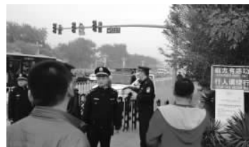
▼28日下午3时许，人民大会堂西侧进入天安门广场的入口已被警方封锁。