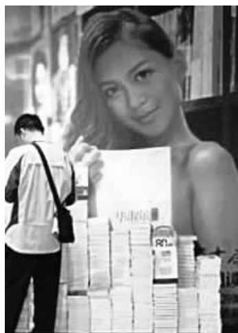
▲南京某书店中的巨幅“裸体阅读”图片。

这被质疑“影响未成年人”,书店方面则解释,这是一场以“裸体阅读——让灵魂更贴近书籍”为主题的图片展,“阅读可以有多种姿态。人们可以抛去外部的修饰来阅读。阅读没有门槛,无处不在。”但读者对此说法并不认同。“裸体就能读好书了么?裸体跟灵魂贴近书籍,有什么关系?”