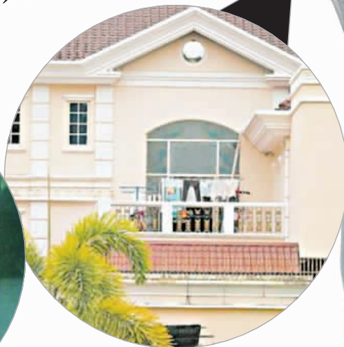
▲吴尊家2011年时被拍到晾着小孩衣服。

前台湾组合“飞轮海”成员吴尊2011年时就被指秘婚及生小孩，虽然一直否认传闻，但他1日突然在官方网志自曝已是“一个幸福的超级爸爸”，并承认已有女儿且已婚，更指“孩子的妈妈”是相恋18年的初恋情人。据悉，吴尊新书2日正式推出，选在此时承认这些“秘事”，外界质疑他有炒作的嫌疑。